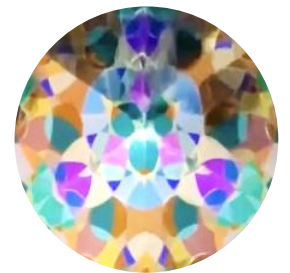
↓海の宝箱を イメージしました。