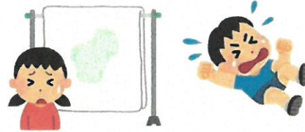
おねしょやかんしゃく等、 いつもと様子の異なる行動