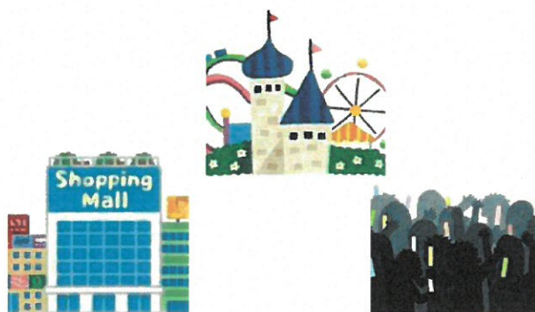
こんざつ 混雑するところにはなるべく い 行かない