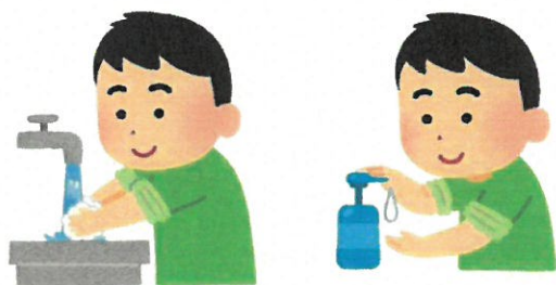
こまめな てあら しょうどく 手洗い・消毒