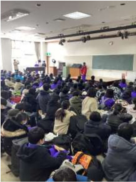
川上郷自然の村への 入所式