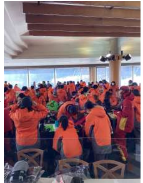
スキー実習に向けて 準備中