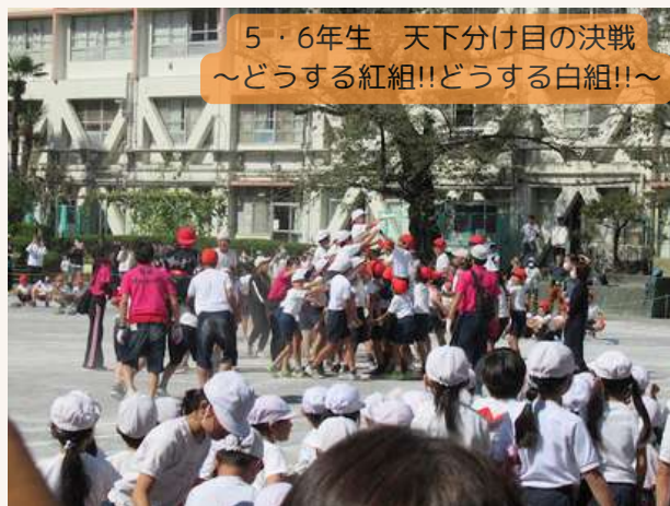
5・6年生 天下分け目の決戦 ~どうする紅組!!どうする白組!!~