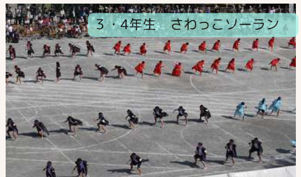
3・4年生 さわっこソーラン