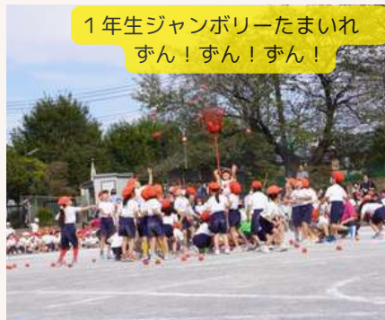
1年生ジャンボリーたまいれ ずん！ずん！ずん！