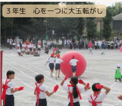
3年生 心を一つに大玉転がし