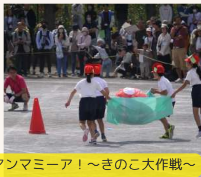
2年生 マンマミーア！~きのこ大作戦~