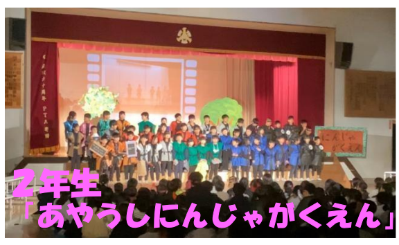
2年生 「あやうしにんじゃがくえん」