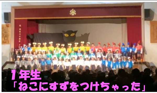
1年生 「おこにすずをつけちゃった」