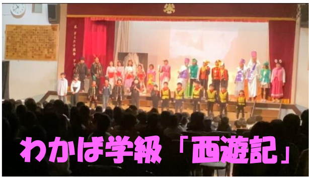
わかば学級「西遊記」