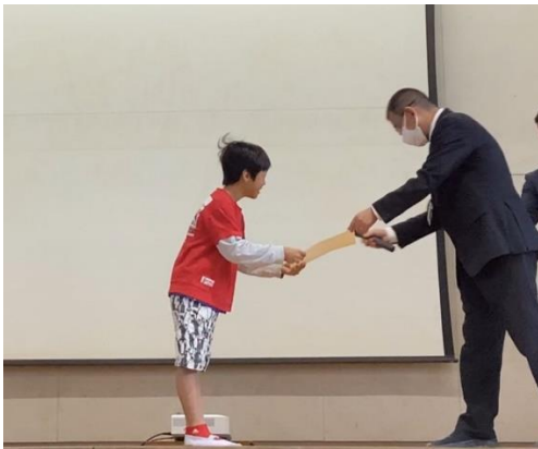
スポーツ大会ビーチフラッグス (2・3年生の部) 優勝