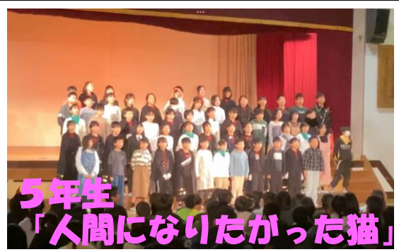
5年生 「人間になりたかった猫」