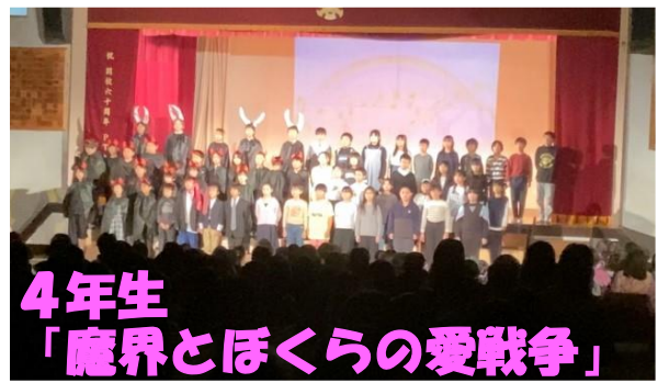
4年生 「魔界とほくらの愛戦争」