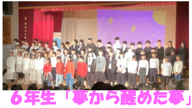
6年生「夢から醒めた夢」