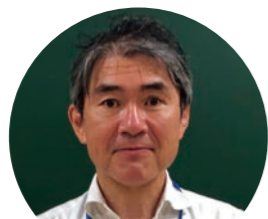
新 苅込 希 井口小学校校長