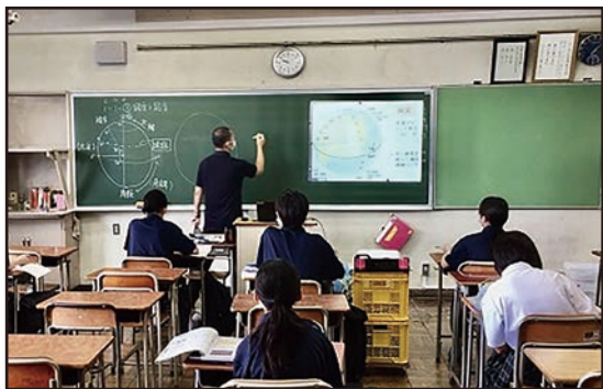
6月に行われた「分散授業」の様子

が始まりました。この間、学校では卒業式、入学式が行われ在校生が不在の中で時間を短縮しての実施、また小学校の遠足や中学校運動会が中止となり、これまで各校が先輩から後輩へ引き継いできた様々な伝統が途切れてしまったことがとても残念でなりません。特に卒業式では練習なしで、卒業式を迎えた卒業生でしたが、とても感動的で立派な卒業式でした。この立派な卒業生の姿を先輩たちに見せてあげられなかったことがとても残念です。また離任式もできなかったため、先生とのお別れの場がなかったことも子どもたちには心残りになっていると思います。 学校が再開されましたが、感染予防のためソーシャル・ディスタンス等をとったうえでの教育活動には多くの制限が子どもたちには課せられています。当たり前にはできない中で子どもたちが我慢を強いられる場面が増えていますが、にしみたか学園の子どもたちは再開された授業に集中し熱心に取り組んでいます。ご家庭や地域の方々にはこれまで以上に子どもたちの不安や不満を受け止めていただき、子どもたちがこれからの未来に向けて夢をもって生活し、新たな伝統を創っていくよう、ご支援をいただければと思います。