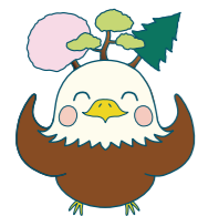
学園キャラクター「あささん」