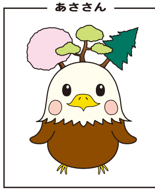
あささんの食べ物は、みんなの挨拶パワー。みんなが挨拶しないとお腹が空いて倒れちゃう。

なキャラクターがあったのでこれが選ばれたのか気になっていました。——このキャラクターに対する思いは？ お腹が減ったときの表現が面白くて、個人的に気に入っています。一緒に懸命考えたキャラクターなので、これからたくさん活躍してほしいです。三鷹の子もたちで「あささん」を元気にしていけたら、にしみたか学園はきっと笑顔あふれる豊かな学園になっていくだろうと期待しています。