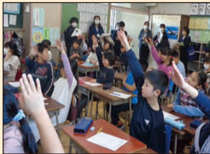
▲活発な発言に驚かされる。