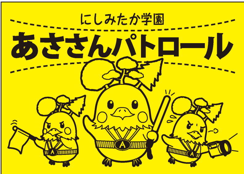
パトロールプレートのデザイン案