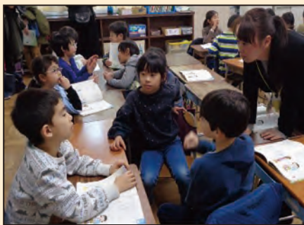
▲自分の考えを述べあう授業。