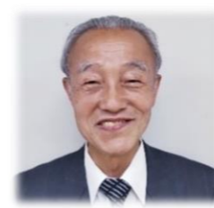
立木 正 (東京学芸大学名誉教授)