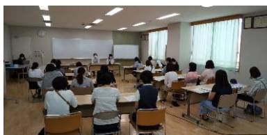
6月の説明会の様子

学園生の「安全な学び」「できた・わかった!」をより多くの方と一緒に見守っていただくと幸いです。ご理解とご協力をお願いいたします。