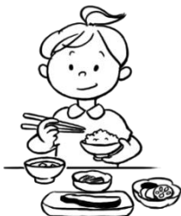
栄養をしっかりとる