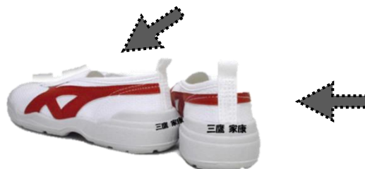
体育館履きは〔カカトの部分とベロの内側〕