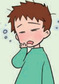
いつも眠そうだったり、脱力感が見受けられる