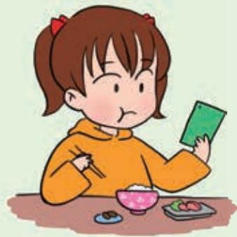
食事中も、ずっとスマホを見たり、操作している