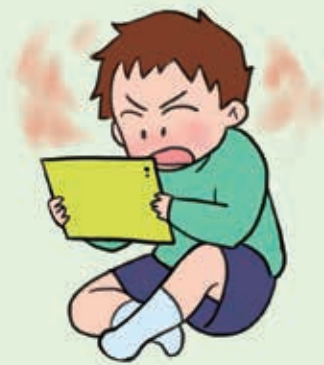
ゲームに夢中になっている