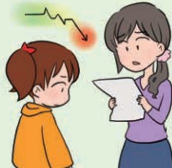
急に学力が下がってきた