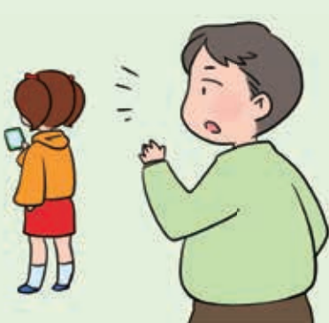
最近あまり会話をしていない