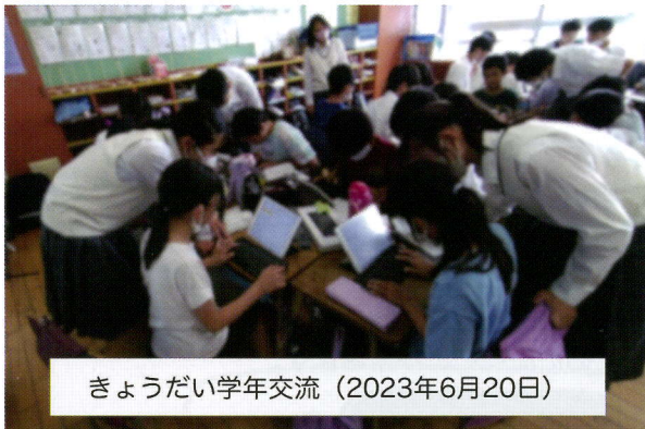
きょうだい学年交流（2023年6月20日）

『きょうだい学年交流』とは入学した新1年生がまだ不慣れな小学校での生活を6年生がお世話をすることで。入学時の組み合わせがその後もずっと続いていく取り組みになります。