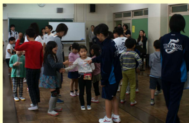
E組&くすのき バレーボールに室内交流に、盛りだくさん楽しみました！