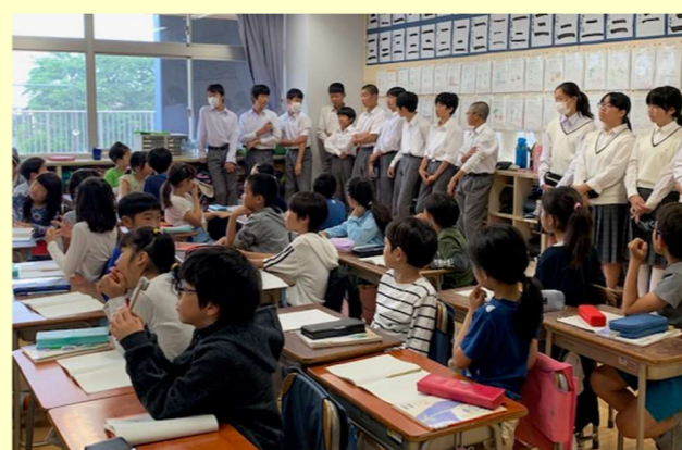
中2&小3 東台では、国語「俳句を楽しもう」中原は算数。教科の交流でした