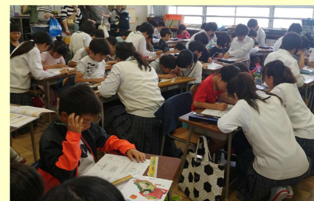
中1&小2 算数「長さ調べ」。色々な物の長さに挑戦。中学生はものさしの使い方をやさしく教えていました。