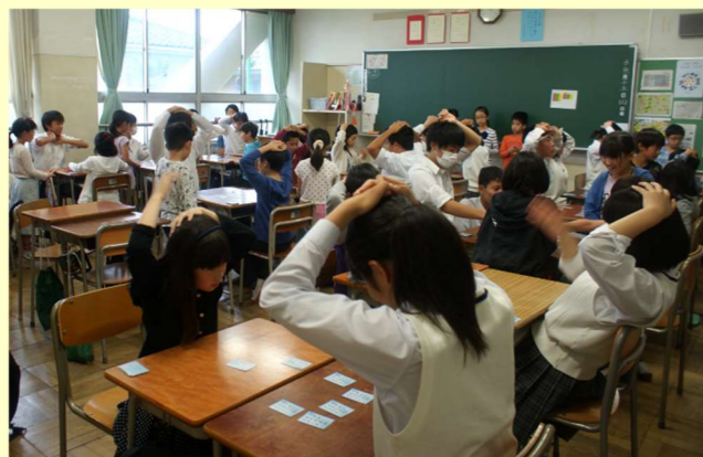
中3VS小4 百人一首大会。どちらも真剣です！

2時間目は、恒例のきょうだい学年交流です。雨が降り、予定が大幅に変更になったところもあったものの、小2・3・4年は入学時にお世話になった中学生のお兄さんお姉さんとの交流をし、たくさんの笑顔がありました。