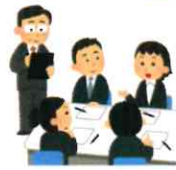
CS委員会は傍聴可能。 問い合わせ：各校副校長まで