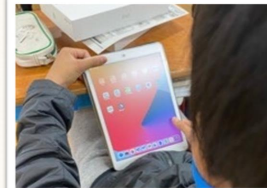
【1人1台タブレット配布】

1月、三鷹市より児童・生徒にタブレットが配布されました。中学校ではタブレットを用いた授業、小学校では、本来学校公開を予定していた土曜日にリモート授業を試験的に行ったり、普段の授業で用いたりして積極的に活用しています。