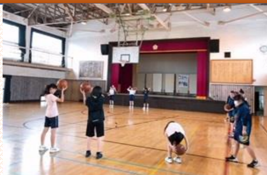
【跳んで!!走って!!中原カップ2020】

7/21(水)6年生による中学校部活動体験を行いました。初めは緊張していた子どもたちでしたが、徐々に慣れていき楽しむ様子が見られました。中学生や顧問の先生方が温かく迎えてくださり、とても貴重な体験となりました。