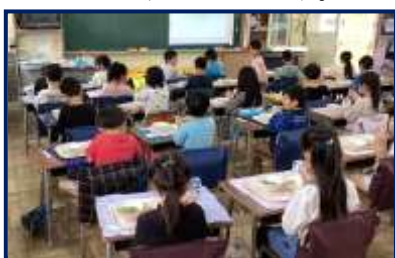
記念すべき1年生の初の給食です。

令和5年度は、最初から「 児童及び教職員に対し、マスクの着用を求めない 」状態でスタートしました。来校する保護者・地域の方々も同様です。(ただし、今後また感染症が流行した場合はマスクの着用を促すことも考えられますが。)マスクをしないで勉強したり、遊んだり、給食を食べたり、当たり前のができなかったこの数年間でしたが、本来の姿が学校に戻ってきたような感じがして、子どもたちの笑顔も多くなっているように感じます。 マスク着用しない・するは、個人の判断です ので、どちらにしても、そのことで区別や差別、いじめ等にならないよう、学校・家庭・地域の皆様とで統一した指導、声かけを維持できればと思います。どうぞ、御協力よろしくお願いいたします。