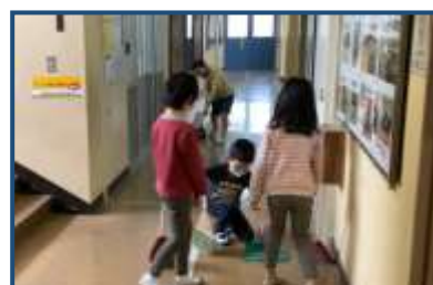
3年生が一生懸命、清掃しています。

4月の1ヶ月というのは、学年が一つ上がり、クラスも変わり、新しい友達も増え、先生も変わる等、変化の大きい月です。しかし、この1ヶ月、子どもたちは前向きに 意欲をもって、毎日元気に過ごしていました 。勉強も、遊びも、役割も、友達との関わりも頑張っていました。校外に出る活動も活発に行いました。2・3・5年生の遠足、3・5年生のサンダファームへのトウモロコシ・枝豆の種まき、わかば学級のヨモギ摘み(5/2に延期しました)。等、学校の中では味わえない、体験できない活動が多くできています。春になり暖かい日も続き、とても過ごしやすい1ヶ月でした。6年生が考えてくれた「 輝け!!可能性無限大の星 」の合言葉どおり、子どもたち一人ひとりのチャレンジする姿、頑張る姿は、正に可能性が無限に広がっており、今後の未来を引っ張っていく「星」のような存在として映ります。