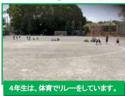
4年生は、体育でリレーをしています。

4月の1ヶ月というのは、学年が一つ上がり、クラスも変わり、新しい友達も増え、先生も変わる等、変化の大きい月です。しかし、この1ヶ月、子どもたちは前向きに 意欲をもって、毎日元気に過ごしていました 。勉強も、遊びも、役割も、友達との関わりも頑張っていました。校外に出る活動も活発に行いました。2・3・5年生の遠足、3・5年生のサンダファームへのトウモロコシ・枝豆の種まき、わかば学級のヨモギ摘み(5/2に延期しました)。等、学校の中では味わえない、体験できない活動が多くできています。春になり暖かい日も続き、とても過ごしやすい1ヶ月でした。6年生が考えてくれた「 輝け!!可能性無限大の星 」の合言葉どおり、子どもたち一人ひとりのチャレンジする姿、頑張る姿は、正に可能性が無限に広がっており、今後の未来を引っ張っていく「星」のような存在として映ります。