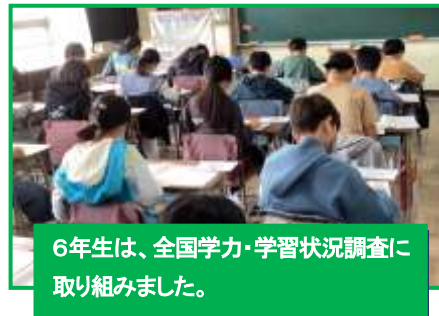
6年生は、全国学力・学習状況調査に取り組みました。

きっと、5月を迎え、大型連休を経ると、この1ヶ月の疲れがどっと出てきます。体調を崩したり、精神的にも不安定になったりする児童が出てくるかもしれません。そんなときには、決して無理はさせず、また、困ったときは、学校でも家庭でも話を聞いたり、相談したりできる大人はたくさんいることもお伝えいただければと思います。