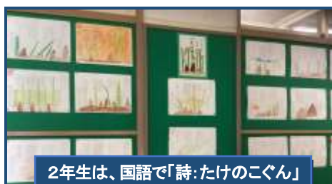
2年生は、国語で「詩:たけのこくん」を視写しました。