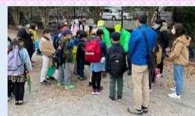
校外学習引率やグループ学習のお手伝い