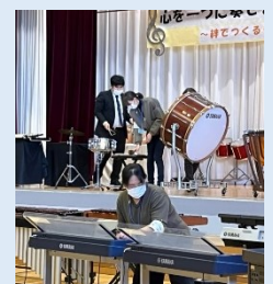
音楽会では1クラス終わる毎に消毒を