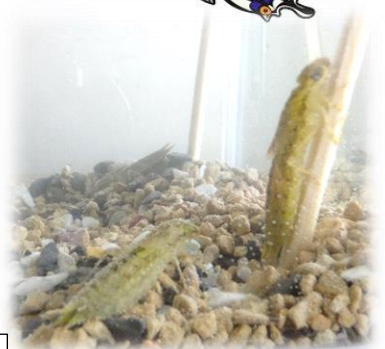
プールで捕ったヤゴ。