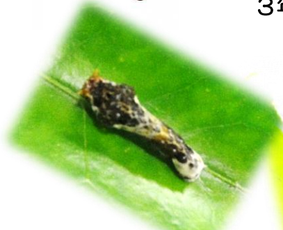
校庭の夏みかんの木で見つけたアゲハチョウの幼虫。