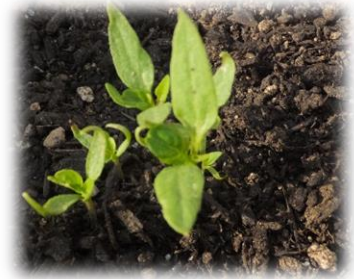
ピーマン。なかなか芽が出ず心配でしたが元気に育っています。