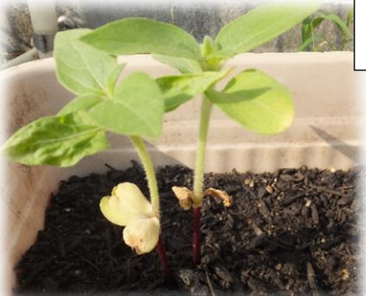
ヒマワリ。子葉がもうすぐ枯れて落ちそうです。