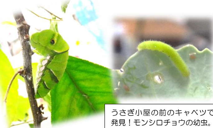
うさぎ小屋の前のキャベツで発見！モンシロチョウの幼虫。