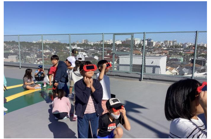
理科 遮光プレートで太陽の位置を調べています。