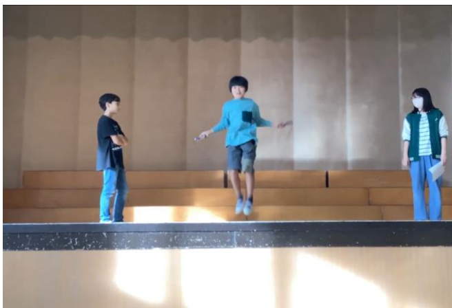
なわとび週間での体育委員会の説明

子供たちの基礎体力の向上を目的として、短なわと長なわに取り組むなわとび週間を実施しています。自分たちでめあてを立て、様々ななわとびの技に挑戦しています。自然と、子供同士で教え合い、楽しそうに活動に取り組む様子が見られます。