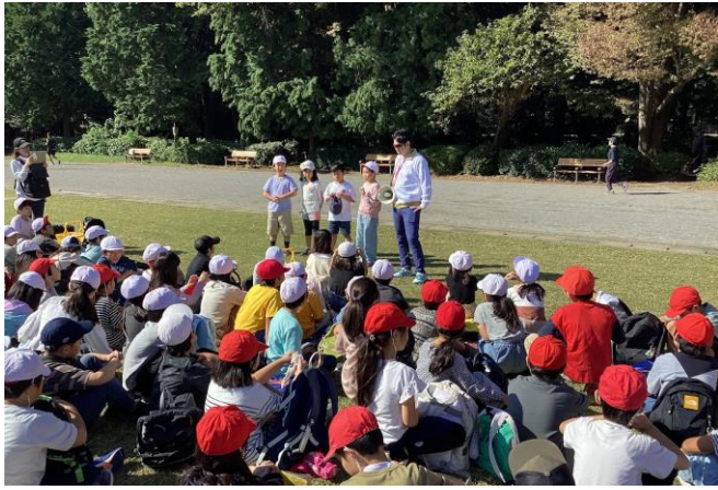
学年交流会 学年全体で仲を深めました。

10月の学年交流会ではクラスで話し合っただけで決めた遊びをみんなで楽しみ、クラスを超えて仲を深めました。それぞれのクラスで実行委員を中心に計画・準備し、当日も自分たちで交流会を進行することができました。また、理科や社会科など、3年生で新しく始まった学習に意欲的に取り組んでいます。4年生への進級に向けて、一人一人がますます成長していけるよう今後も指導してまいります。