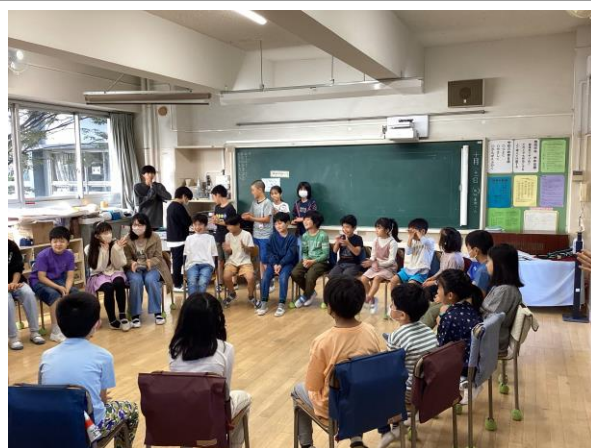
ミニスマイル班集会