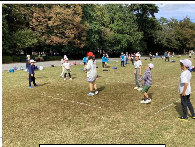
5年生と2年生が遊ぶ様子

先日、2年生との合同学年交流会を行いました。井の頭公園で5年生主催のポイントラリーをしたり、2年生が考えた遊びを楽しんだりしました。また、ミニスマイル班集会においては遊びを考えたり、進行を務めたりもしています。学校全体のリーダーとなれるように、試行錯誤を繰り返しながら着実に成長している姿がとても頼もしいです。6年生の姿を見ながら、今後さらに成長し続ける5年生の子供たちに期待したいです。