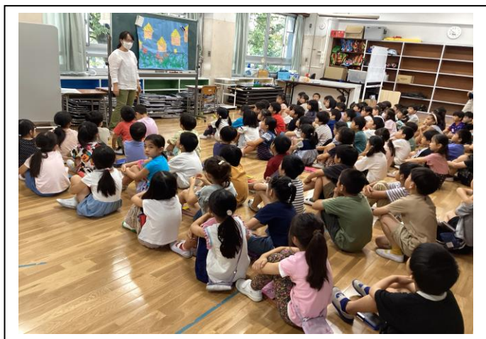
学年展示づくりの様子（1年生）

先日はたくさんの方々に図工展に来ていただき、誠にありがとうございました。子供たちの作品にそれぞれの素敵な個性があり、作品ができる過程を一緒に過ごせたことは、私にとってかけがえのない時間となりました。子供たちは、クラスごとに図工展を鑑賞しました。作品の良さをメモしたり、伝えあったりして、多様な作品の面白さを感じ取ることができていました。これからも図工の時間を通して、子供たちの作品のよさを感じ取れるように、そして作品づくりから自分のよさを見つけられるようにしていきたいと考えています。今後ともご支援ご協力よろしくお願いします。