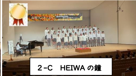
2-C HEIWA の鐘