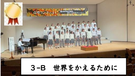
3-B 世界をかえるために

この日に至るまでに数多の「壁」を乗り越えてきた生徒たち。試行錯誤を繰り返しながら、2つの「歌」を大切に「紡いで」きました。光のホールは、五中生の奏でる美しいハーモニーが響き渡り、明るく、そして温かな空気が満ち溢れていました。思いを込めて堂々と歌い上げたE組。澁刺として伸びやかに歌った1年生。一気に音の厚みが増し大きな成長を感じさせた2年生。そして、曲想を深く理解した上で高らかに難曲を歌い上げた圧巻の3年生…。歌い終わった一人ひとりの、晴れやかで清々しい表情が、この行事の素晴らしさを雄弁に語ってくれていました。五中が更に、大きく成長できたことを実感しました。